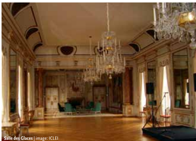
Salle des Glaces