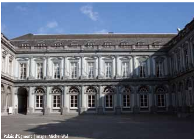
Palais d'Egmont

Tous les participants sont invités à une réception de bienvenue organisée par la Région de Bruxelles-Capitale dans la magnifique Salle des Glaces du Palais d'Egmont à Bruxelles, situé à seulement huit minutes à pied du BOZAR. L'ambiance sera assurée par le groupe de jazz Igor Gehenot Trio, digne représentant de la jeune et dynamique scène jazz bruxelloise.