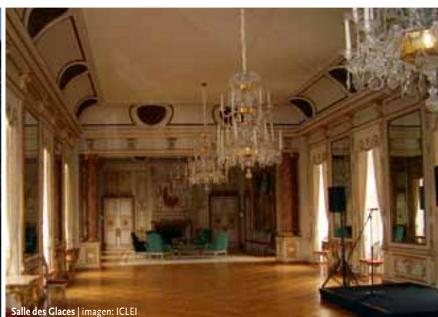
Salle des Glaces