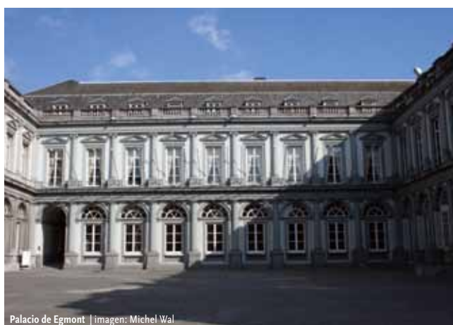
Palacio de Egmont

Todos los participantes están invitados a la recepción de bienvenida organizada por la Región de Bruselas-Capital que tendrá lugar en la espléndida Salle des Glaces del Palacio de Egmont de Bruselas, a sólo ocho minutos a pie de Bozar. Un grupo de jazz, el trío Igor Gehenot, ambientará la recepción y reflejará el vibrante y joven panorama del jazz de la ciudad.