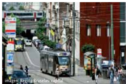
imagen: Región Bruselas-capital

Los participantes podrán pasear por el imponente "Promenade Verte" – una manera idónea de recorrer el cinturón verde de la región.