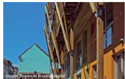
imagen: Región de Bruselas capital

Recorra uno de los barrios más sostenibles de Bruselas y vea de primera mano las ideas sostenibles puestas en práctica.